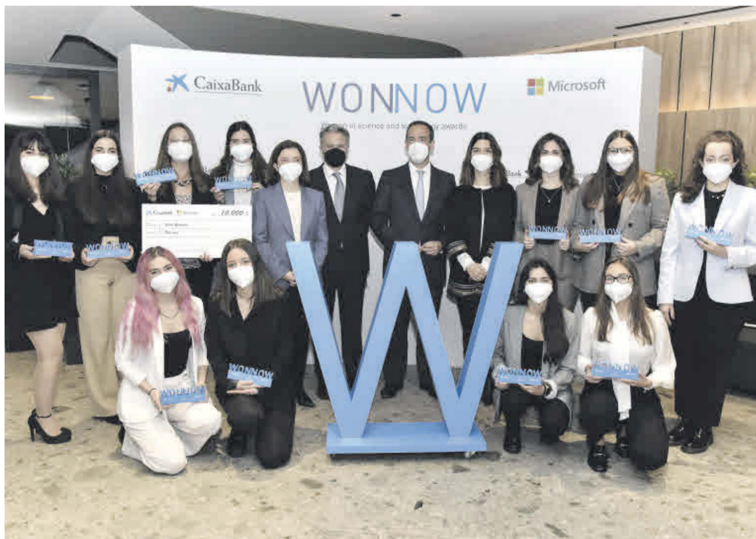
Premiades. Guanyadores dels Premis WONNOW i responsables de CaixaBank i Microsoft.

QUATRE EDICIONS. En aquesta quarta edició, hi han participat un total de 723 estudiants de